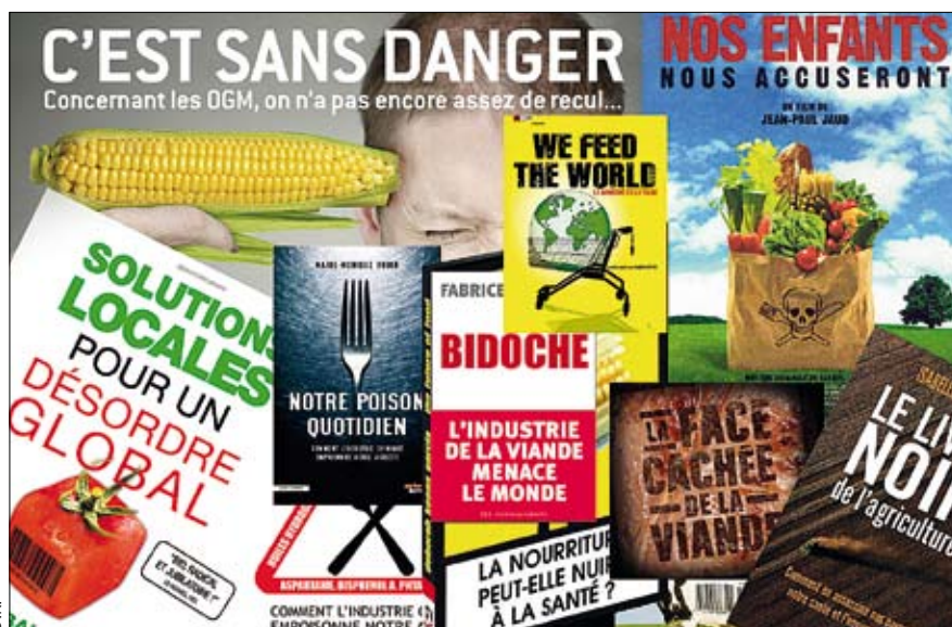
DES CAMPAGNES MÉDIATIQUES SOUVENT SPECTACULAIRES ACCUSENT LE MODÈLE AGRICOLE.

Pour le président du Centre national de la médiation, le théologien Jean-François Six, la médiation « c'est la relation entre deux, l'espace vide autour duquel on se rencontre, la table qui sépare et réduit, le troisième terme qui fait le lien, qui permet aux "deux" de trouver sens, l'un par l'autre ».