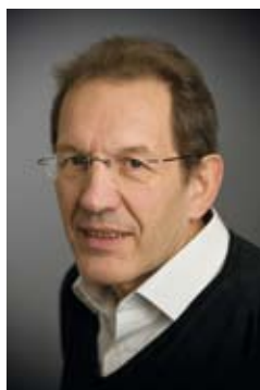
JEAN-CLAUDE BÉVILLARD, SECRÉTAIRE NATIONAL DE FNE (FRANCE NATURE ENVIRONNEMENT) EN CHARGE DES QUESTIONS AGRICOLLES

l'appui d'un médiateur. Ainsi, ont accepté de participer à cette médiation : France nature environnement (qui représente plus de 3000 associations locales de défense de l'environnement), les prin-